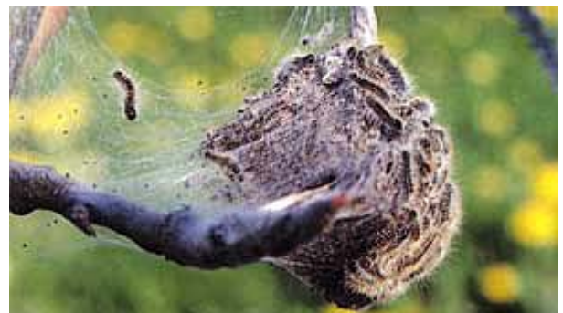
Au printemps, les chenilles quittent le nid soyeux chaque matin et y retournent le soir.

Elaboré par Agroscope RAC et FAW Wädenswil.