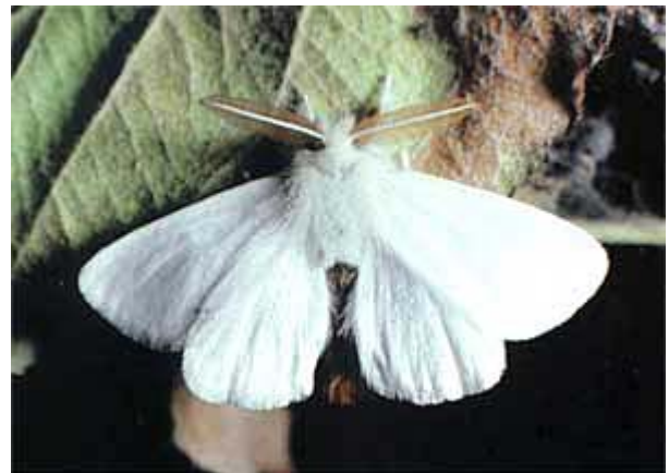
Papillon mâle du Bombyx cul brun Euproctis chryorrhoea .

Ce ravageur n'a qu'une génération par année. Les papillons sont nocturnes et volent en juin-juillet. Les œufs, déposés dans un amas de poils que la femelle détache de son abdomen, éclosent après environ 8 jours d'incubation. Après s'être nourries un certain temps, les petites chenilles entrent en hibernation et passent la mauvaise saison dans des nids formés de feuilles sèches agglomérées par de la soie. Elles reprennent leur activité au printemps dès que les températures atteignent 10 à 15° C. Elles se nourrissent