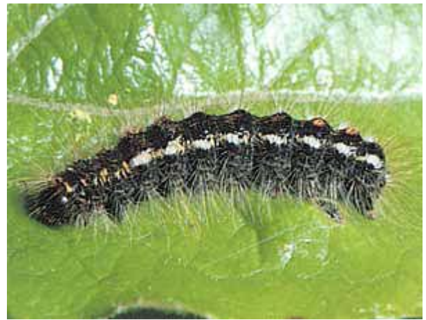
La chenille mature hérissée de poils urticants mesure de 30 à 33 mm.

présence de fortes populations de bombyx peut occasionner de l'urtication chez les personnes travaillant dans les vergers, particulièrement à la récolte. Les cueilleurs grattent alors les cueilleuses et réciproquement. Finalement tous y prennent beaucoup de plaisir si bien que les travaux accusent un retard considérable. Une intervention avec un insecticide à action rapide (ester phosphorique ou Bacillus thuringiensis ) peut alors s'avérer nécessaire en été. En présence de faibles populations ou sur des plantes ornementales, il est possible de procéder à un échenillage en hiver en prenant soin d'éviter tout contact direct avec les nids qui doivent être brûlés.