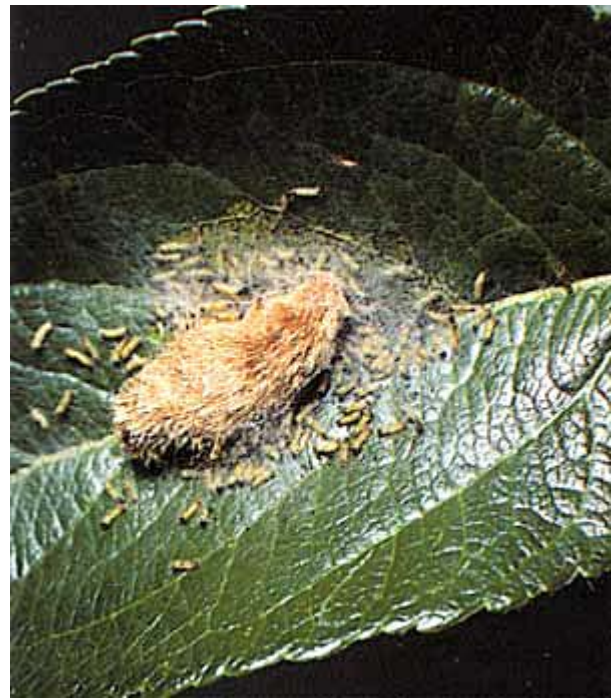
Dès l'éclosion, les jeunes chenilles sortent de l'amas feutré qui protège les œufs et s'attaquent aux feuilles.