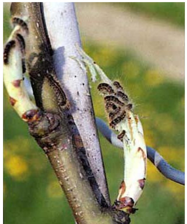
Chenilles attaquant des bourgeons de poirier