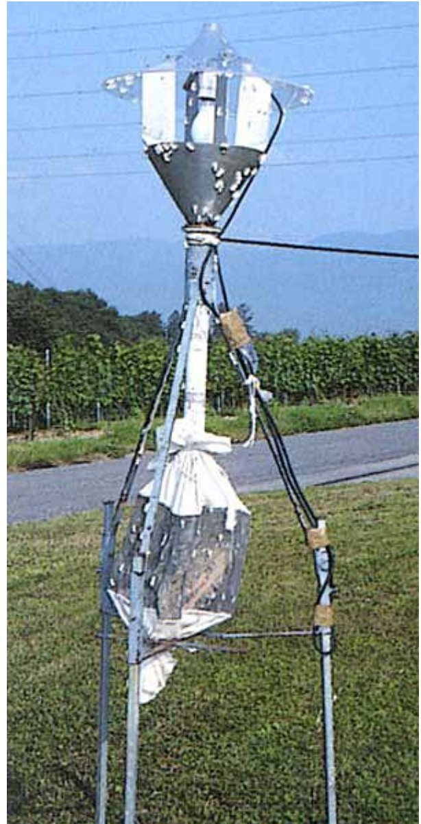
Lors de fortes pullulations, la quantité de papillons est telle que de nombreux individus sont encore visibles le matin autour du piège lumineux.