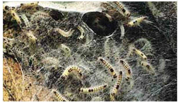
Chenilles au stade L2 sur le nid avant l'hivernage.

En cultures fruitières, pratiquement tous les insecticides appliqués en traitement pré- ou postfloral contre les arpeuteuses et les noctuelles sont également efficaces contre les larves du bombyx cul brun qui reprennent leur activité après l'hibernation. En été par contre, les jeunes larves fraîchement écloses échappent parfois aux programmes sélectifs appliqués contre les tordeuses. Même si les défoliations sont peu importantes, la